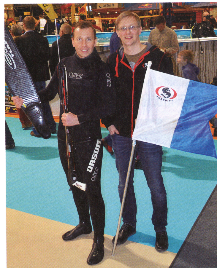
Sukelluskalastus sai huomiota muun muassa Helsingin Venemessuilla