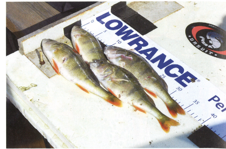
Sukelluskalastajan komea ahvensaalis on päässyt punnitukseen.