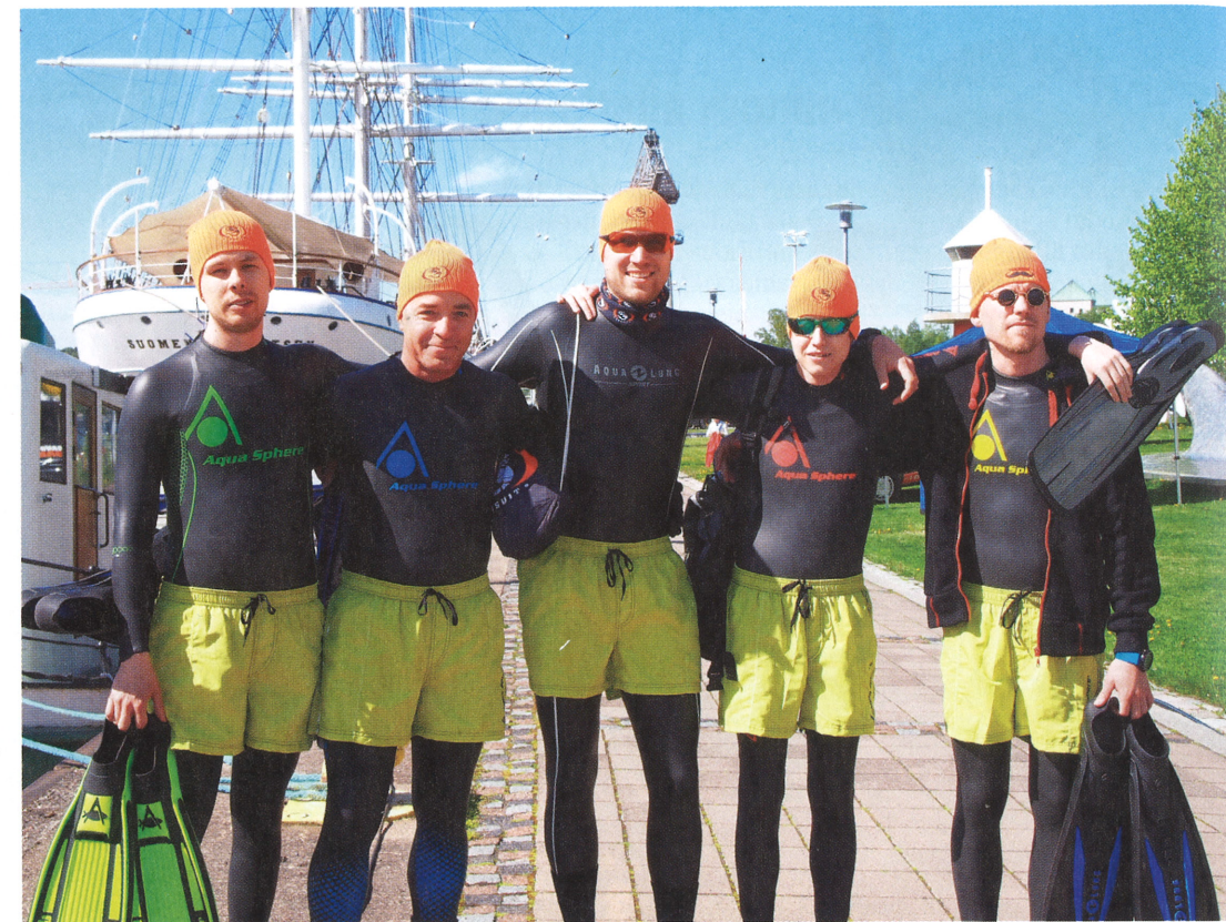
Ursuk Oy:n joukkue täpinöissään. Tuloksena toinen sija.

Kolme joukkuetta lähti kisaan. Joukkueet olivat Merikeskus Forum Marinumista, Kuntecin sponsoroima joukkue sekä Ur- suk Oy:n joukkue. Odotettavis- sa oli kova kisa, jonka Kuntecin joukkue voitti, Ursuk oli toinen ja Forum Marinum kolmas.