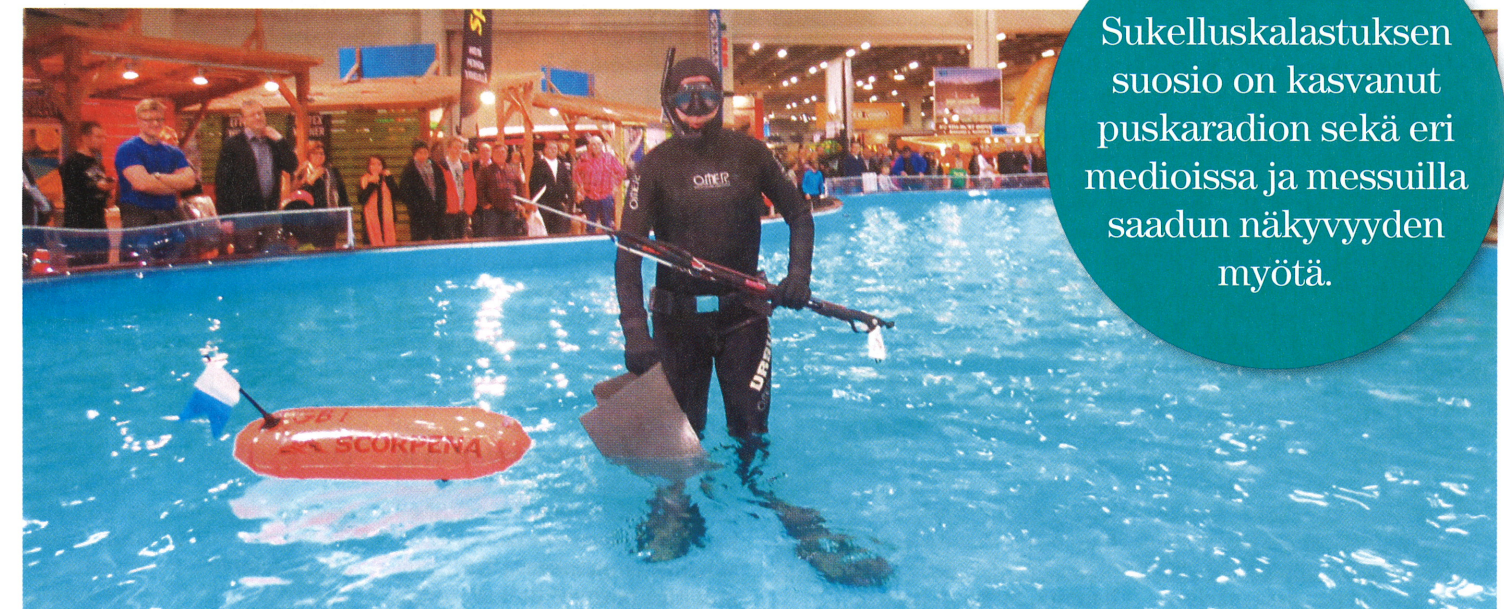
Venemessuilla näytökseen osallistuneelta sukelluskalastajalta ei puuttunut muuta kuin elävä saalis.

Sukelluskalastuksen suosio on kasvanut puskaradion sekä eri medioissa ja messuilla saadun näkyvyyden myötä.