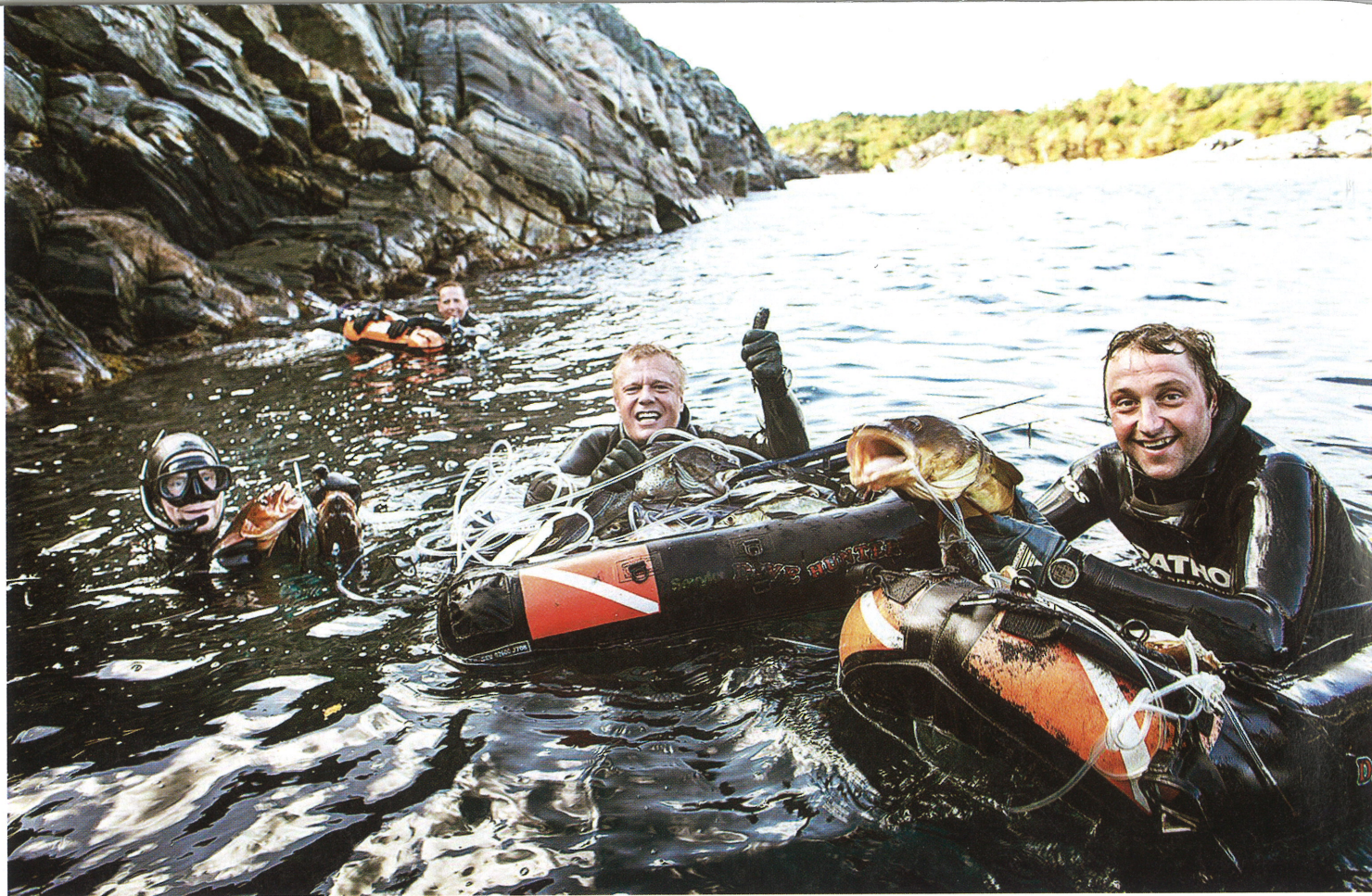
Sukelluskalastuksen SM-kisoja järjestetään kesällä kaksin kappalein.