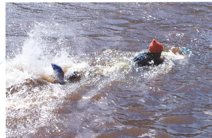
Tästä voisi jo kysyä, mikä moottori. Räpylät kuitenkin näkyvät.