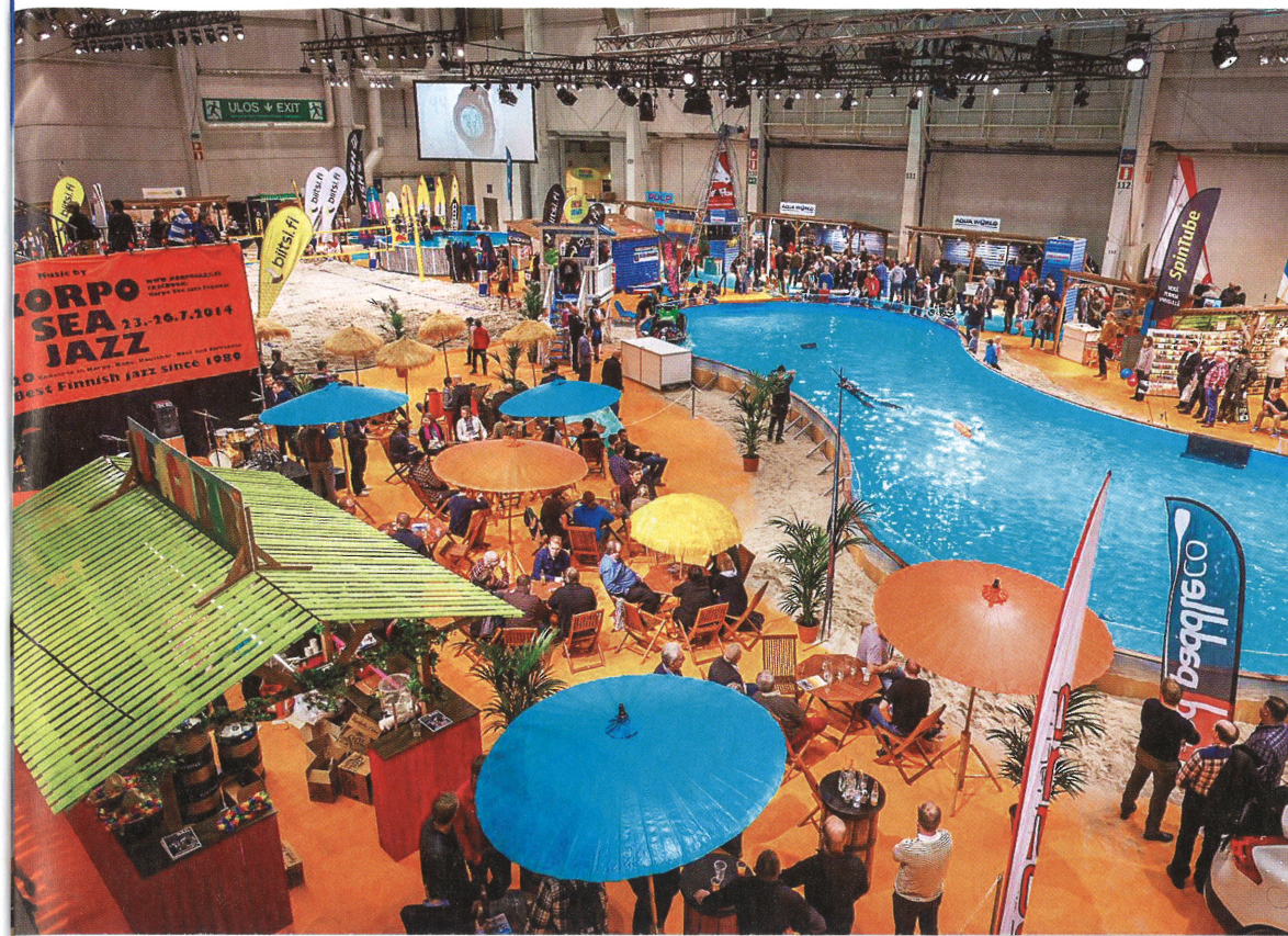
Venemessuilla yleisö pääsi seuraamaan sukelluskalastusta, tosin allasoloissa.

Sukelluskalastajalla on kaksi tapaa saalistaa: etsiä tai odottaa. Kaloja saalistetaan vapaasukel-