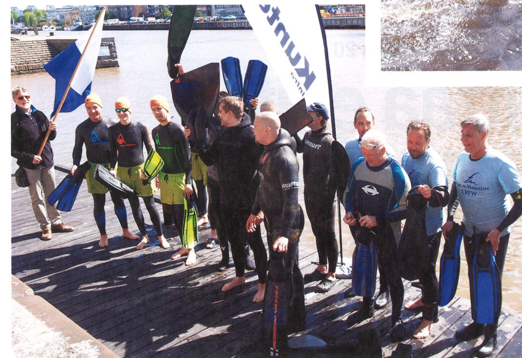
Palkintojenjaon yhteydessä pyydettiin kilpailijoita esittelemään kilpailuvälineensä.

Kilpailussa ei vielä ole kiin- nitetty huomiota kilpailuvälinei- siin, erityisesti räpylöihin. Kisan jälkeen tästä käytiinkin kiivasta, mutta sopisaa keskustelua. – Totta on, että tavalliset su- keltajan umpikantaräpylät monoräpylää vastaan eivät anna mahdollisuutta tasavertaiseen ki- saan. Katsotaan vuoden kuluttua, pitäisikö jo olla kaksi kilpailu- luokkaa, toinen harrastajan rä- pylöin ja toinen ”ammattilaisen” uintivälinein, Moisala totesi. □