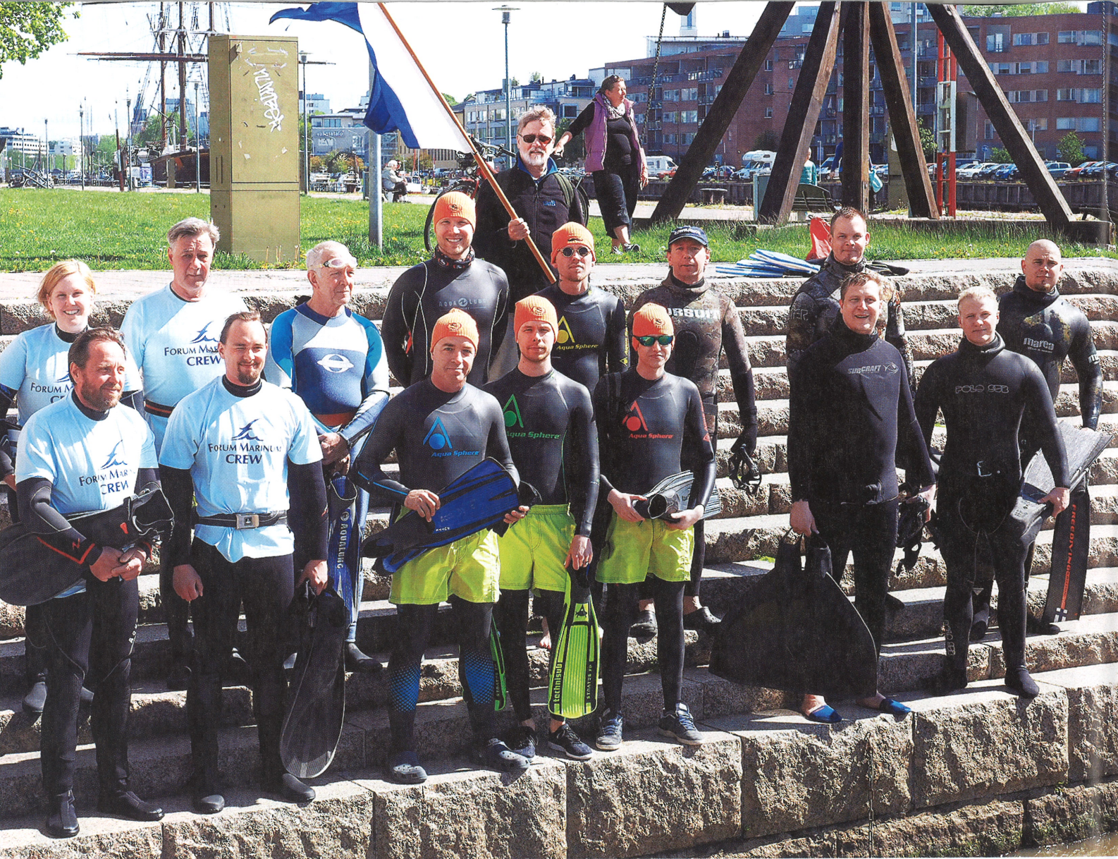
Yhteiskuva joukkueista Venetsialaisilla portailla ennen kisan alkua.